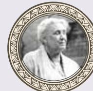
LAURA JANE ADDAMS

Igualmente se muestra el papel del Trabajo Social en la defensa de los derechos sociales, con la consiguiente superación del antiguo concepto de beneficencia.