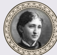
MARY ELLEN RICHMOND