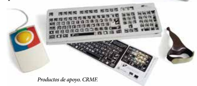
Productos de apoyo. CRMF.

Por último, en vitrinas y expositores, se muestra una selección de dispositivos de apoyo utilizados para mejorar la calidad de vida de estas personas.